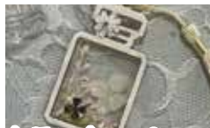
クラフト・パフェ