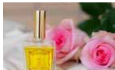
新潟・ラベンダー物語